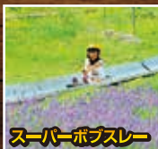
スーパーボブスレー